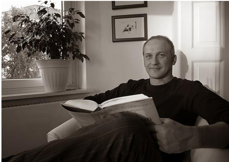
Autor der Dahlke-Biografie: Rüdiger Petersen

Endlich ist auch eine Biografie zum pommerschen Schauspieler Paul Dahlke auf dem Buchmarkt erhältlich. Ihr Autor, Rüdiger Petersen, hat darüber hinaus eine ganz besondere Verbindung zur Insel. Wir sprachen mit dem ausgewiesenen Experten für das Filmschaffen der 1930er bis 1960er Jahre.